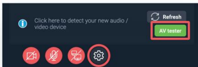
Ryc. 3. Ikony sterowania widziane na monitorze podczas zajęć w grupach do 25 osób.

Powyżej widzimy obraz przedstawiający ekran monitora na zajęciach w grupach do 25 osób. Oprócz listy uczestników i okna czatu uczestnicy zajęć w dolnej części ekranu mają do dyspozycji cztery przyciski umożliwiające włączenie lub wyłączenie – od lewej: kamery, mikrofonu, współdzielenia ekranu oraz tzw. trybu kontroli ustawień obrazu i dźwięku (Ryc. 3). Oczywiście wszystko odbywa się pod nadzorem osoby prowadzącej lub organizującej spotkanie.